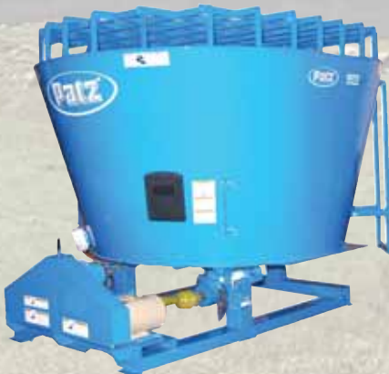
Modèle surbaissé 270 pi 3 (7,6 m 3 )