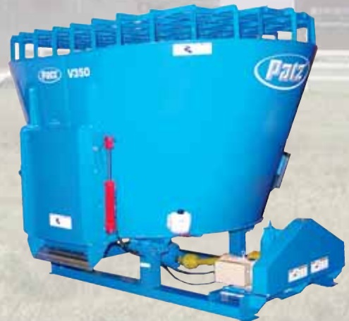
350 pi 3 (9,9 m 3 )